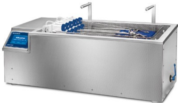
Sonomic MC 1001