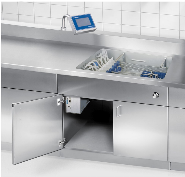
Sonomic MC 1001 E

Laite tuottaa pesunesteeseen energiaa. Syntyy pieniä ilmakuplia joita kutsutaan kavitaatioksi. Kavitaatio ns. "elektroninen harjaaminen", irrottaa likaa ja epäpuhtauksia tehokkaasti ahtaistakin paikoista siirtäen ne pesunesteeseen.